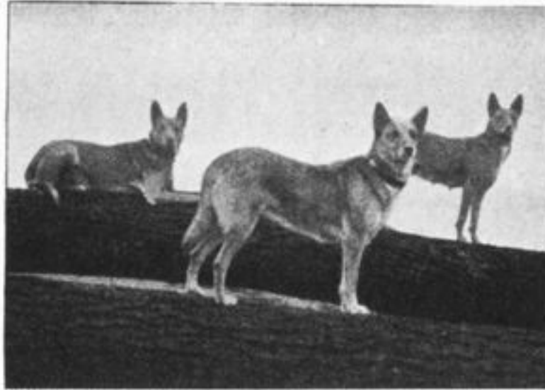
„Cora I“, „Fritz“ en „Thylla“, van den Heer L. OPDEBEECK, Mechelen. (Gravure uit Chenil et Basse-Cour. )

houdt hij den staart op met een lichte kromming. Geen krul- of scheef gedragen staart. Dikwijls worden er Herdershonden geboren zonder staart; die met een stompje, of waarvan de staart is ingekort, worden gediskwalificeerd.